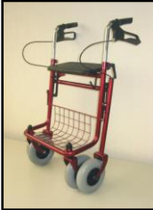
Abb. 12 Aufbewahrung

Nehmen Sie den Einkaufskorb und das Tablett ab. Lösen Sie die Bremse. Drehen Sie die Faltsicherung im Uhrzeigersinn, dann ziehen Sie die Querstrebe gerade nach oben.