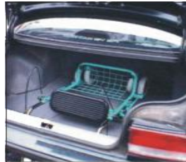
Abb. 13 Transport